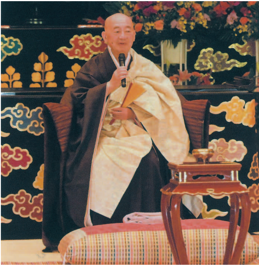
大本山總持寺入山式にて (令和3年)

昨年十月十日、總持寺にて入山式が執り行われました。禪師さまにはこれまで二回宝泉寺に来ていただきました。最近では、平成十三年に先代方丈様の結制にお呼びさせて頂きました。大変優しいお人柄で、ありがたいお話を頂きました。