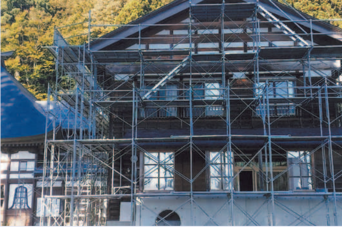
庫裡正面 屋根の塗装から5段の足場