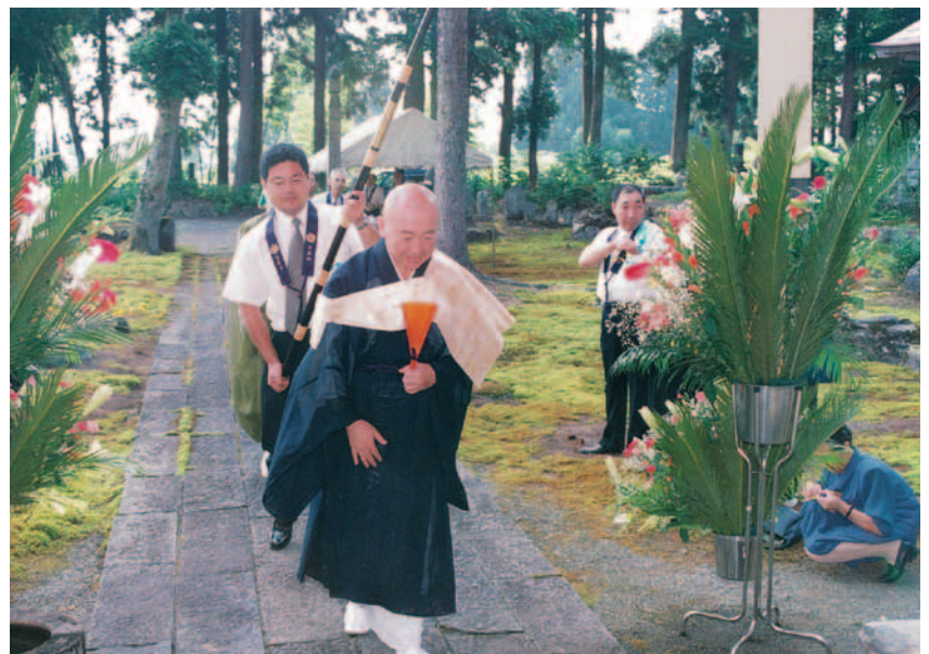
宝泉寺にて (平成 13 年)